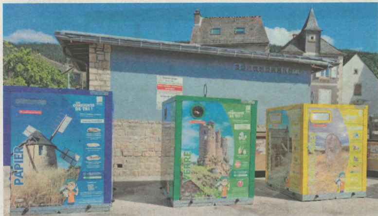
Des bacs de tri très esthétiques.

Les agents du Syndicat départemental d'énergie et d'équipement de la Lozère (SDEE) sont intervenus le 29 août au matin sur la place de la Mairie pour procéder au remplacement des bacs de tri sélectif par de nouvelles colonnes plus esthétiques, parées de visuels mettant en valeur les richesses du patrimoine lozérien dont le site tout proche de la Cham-des-Bondons.